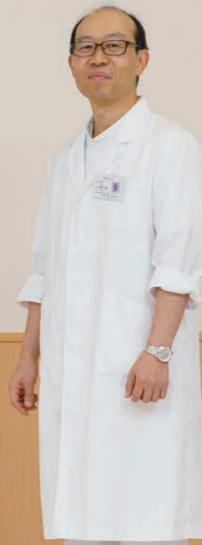
※新型コロナウイルスへの感染防止に十分配慮して撮影しております。